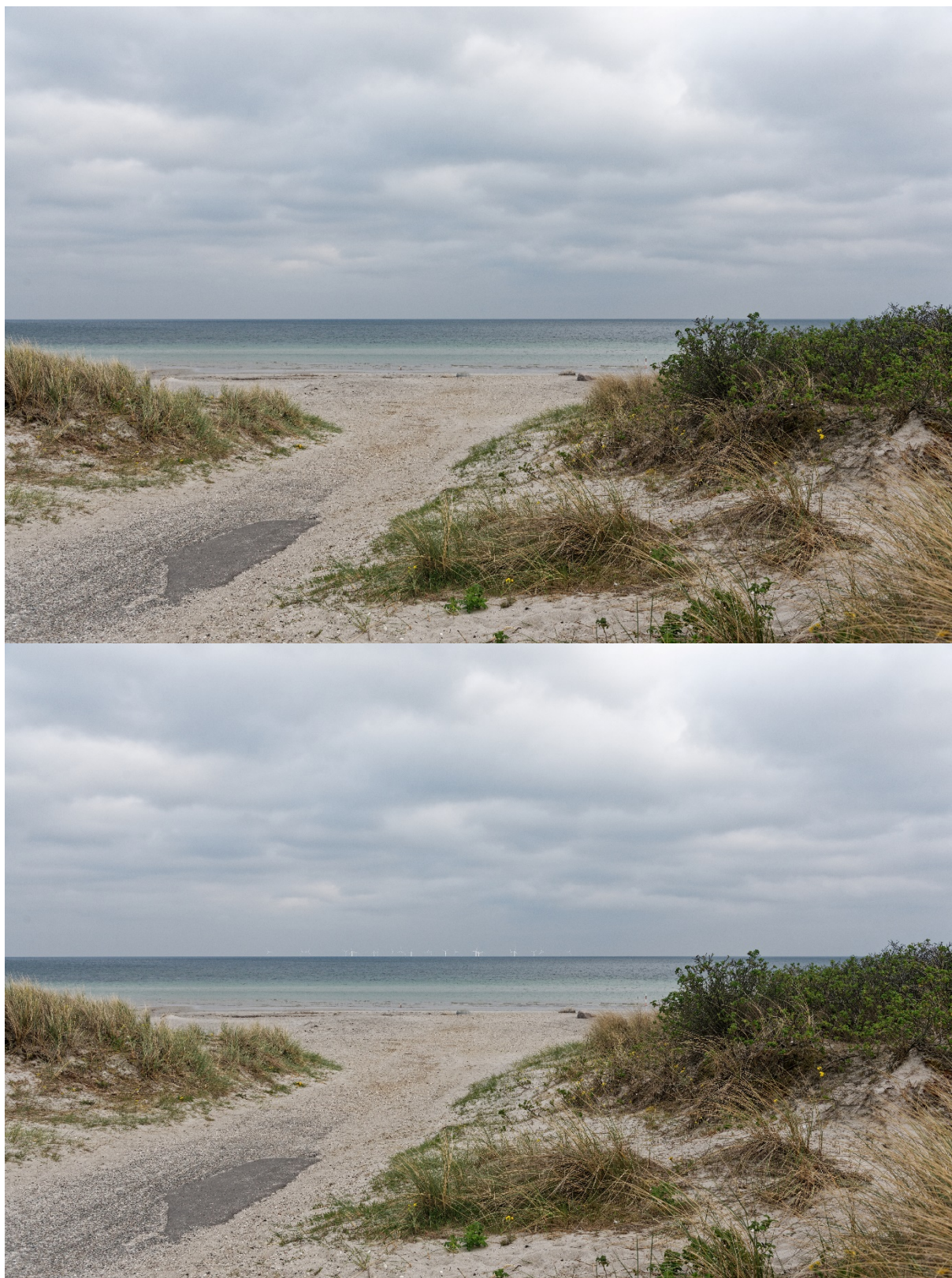
Figur 4: Øverst: Eksisterende forhold fra fotostandpunkt 03.

Nederst: Indledende visualisering af Aflandshage Vindmøllepark fra fotostandpunkt 03 baseret på en skitse til mulig opstilling af de største mølletyper.