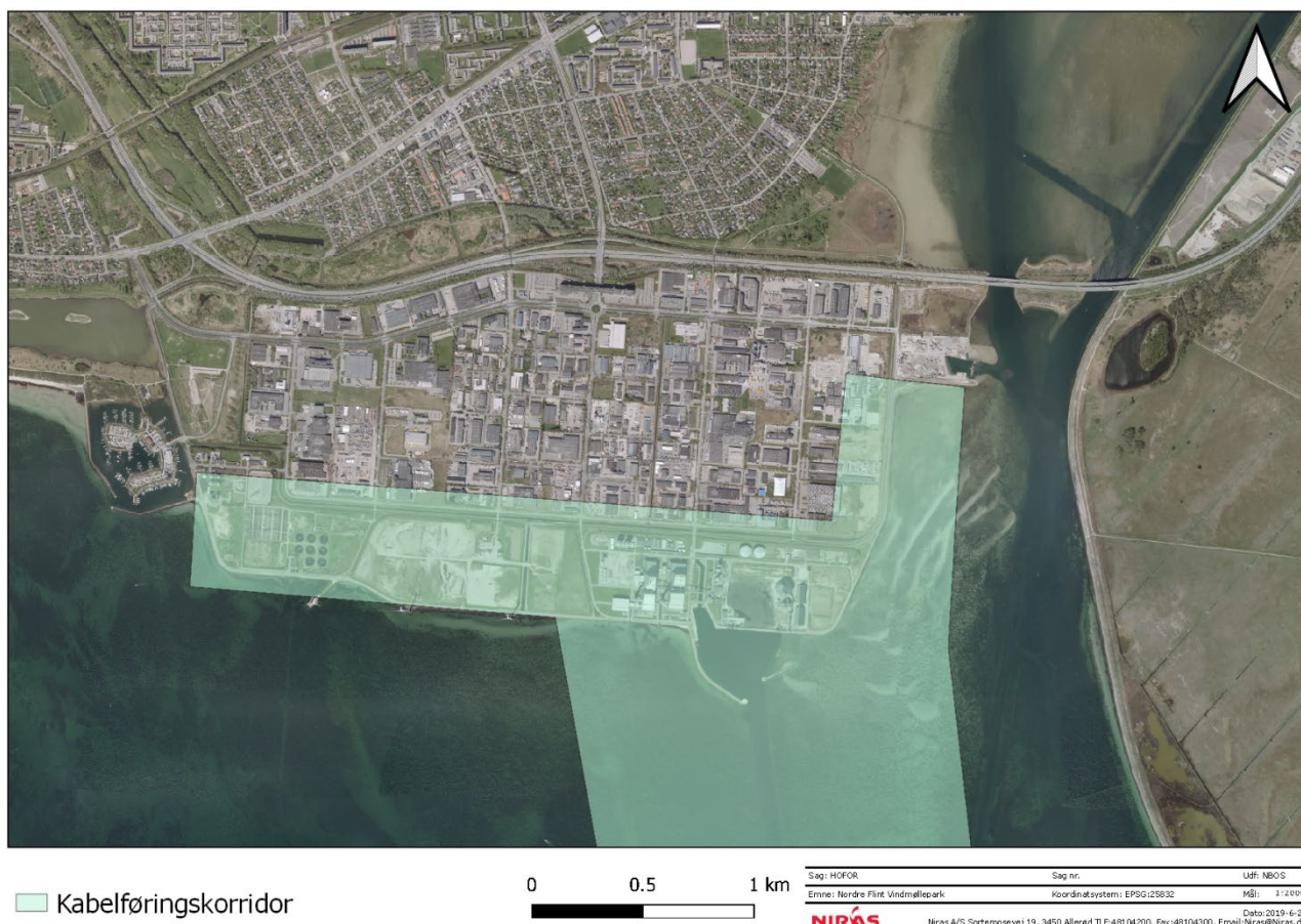
Figur 2: Korridoren for landkabler og nettilslutning ved Avedøreværket.

Korridoren for kabler på land forventes derfor at være meget kort, hvilket fremgår af Figur 2.