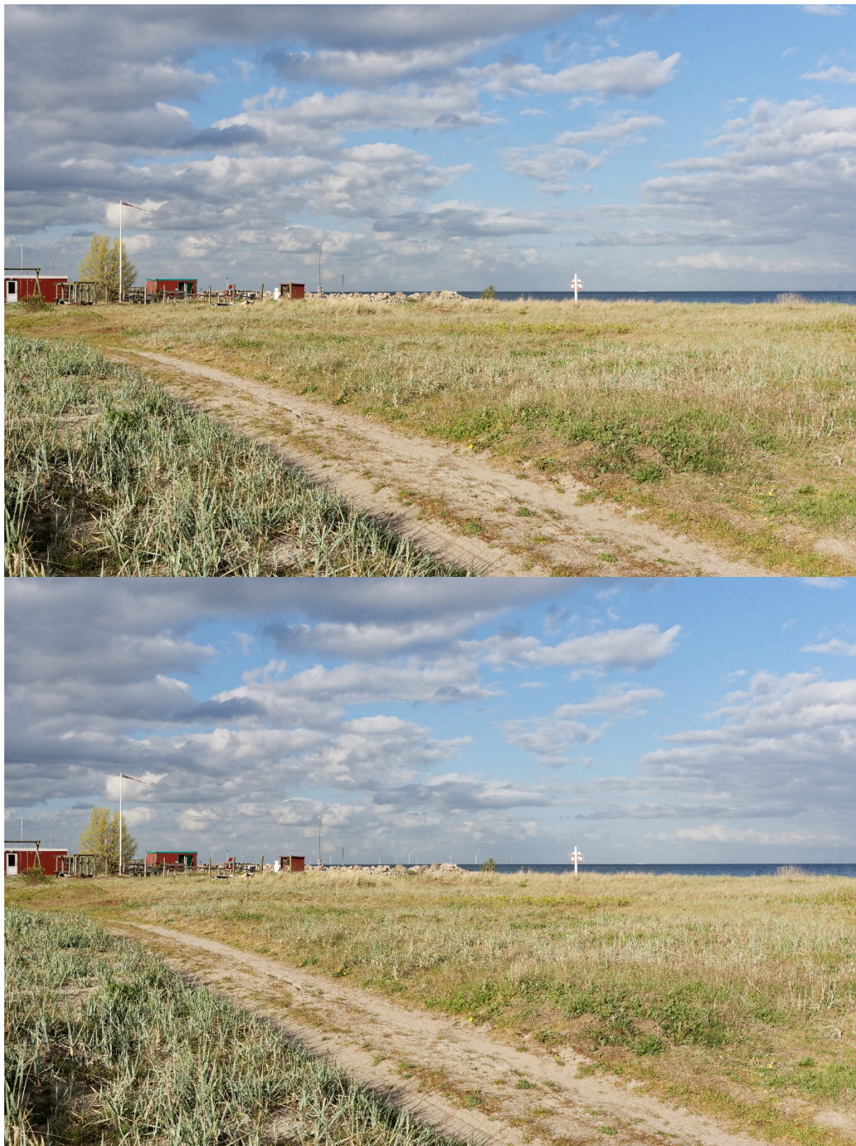
Figur 3: Øverst: Eksisterende forhold fra fotostandpunkt 01.

Nederst: Indledende visualisering af Aflandshage Vindmøllepark fra fotostandpunkt 01 baseret på en skitse til mulig opstilling af de største mølletyper.