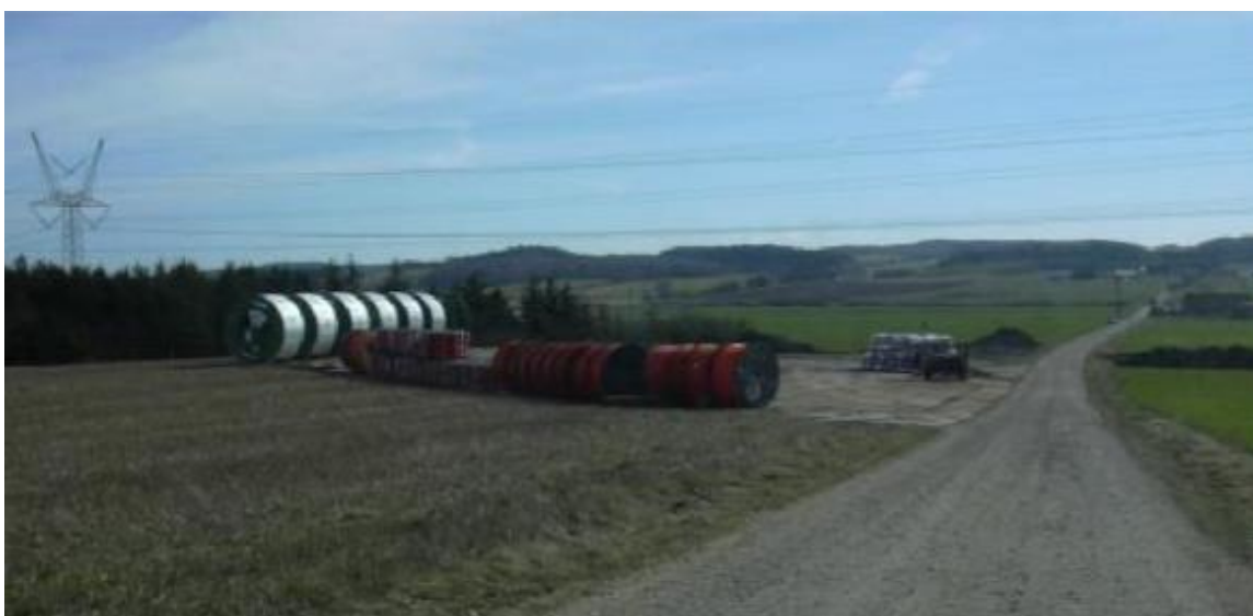
Figur 5 Eksempel på tromledepot, som er et midlertidigt oplags- og arbejdsområde

I forbindelse med anlægsarbejdet er der behov for at etablere et antal midlertidige oplags- og arbejdspladser i nærområdet ved et kabeltracé. Der er tale om arbejdspladser ved alle underboringer (ca. 1.000-1.500 m 2 ), udvidelse af arbejdsområde, hvor kablerne samles for hver 2-3 km (ca. 800 m 2 ), depotpladser for hver 2-3 km (ca. 3.000 m 2 ) samt en skurby (ca. 3.000 m 2 ). Alle oplags- og arbejdspladser etableres inden for projektområdet på arealer, som ikke er omfattet af naturbeskyttelse eller på anden vis ikke egner sig som oplags- eller arbejdspladser. Et eksempel på et tromledepot er afbilledet på Figur 5.