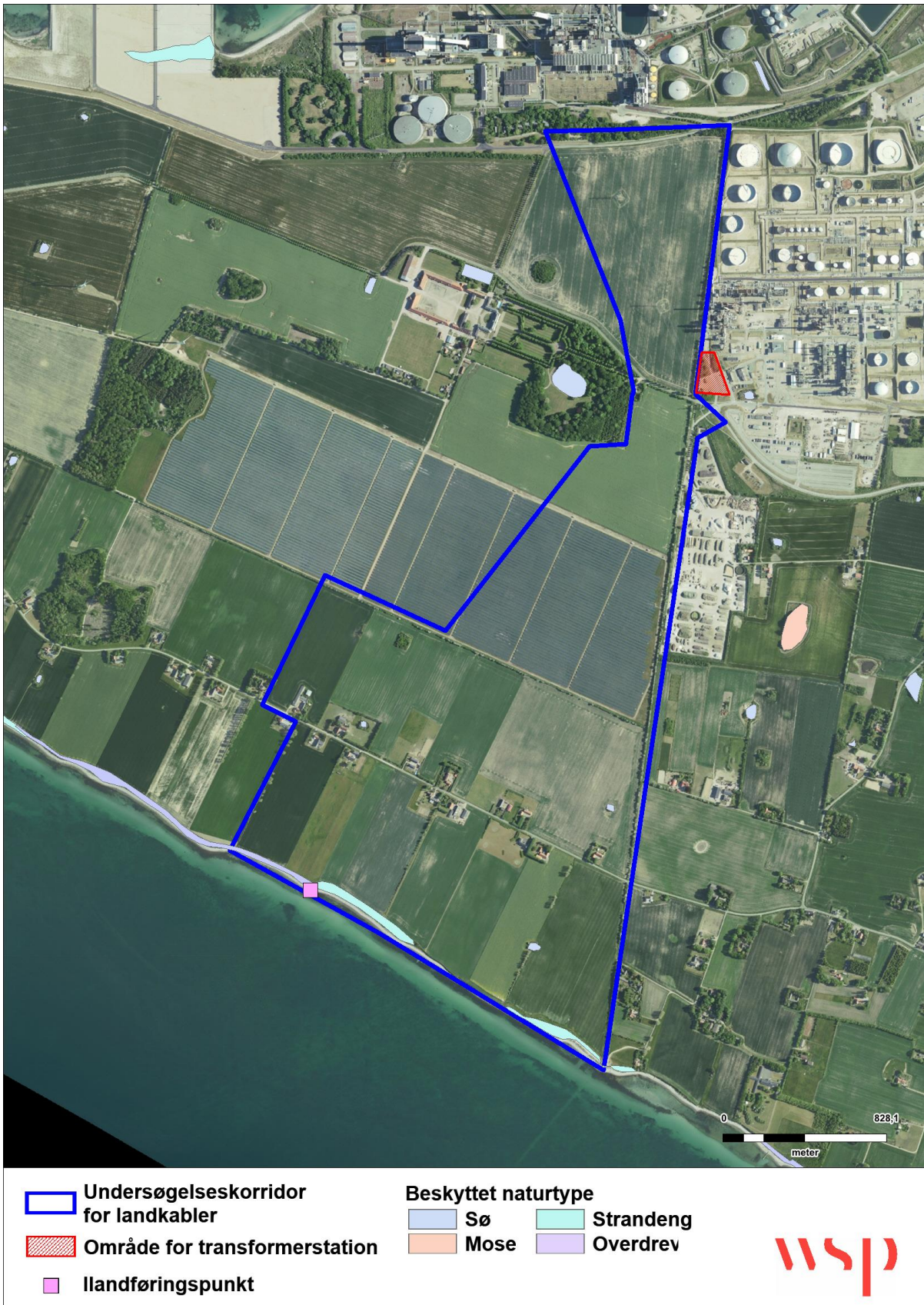
Figur 8 Beskyttede naturtyper fra miljøportalen.