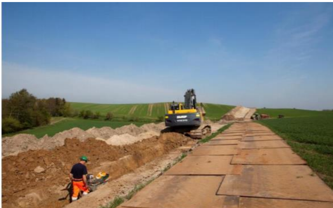
Figur 4 Eksempel på arbejdsbælte langs kabelanlæg med afrømmet rå- og muldjord samt køreplader. På billedet ses et kabeltracé med ét kabelanlæg.