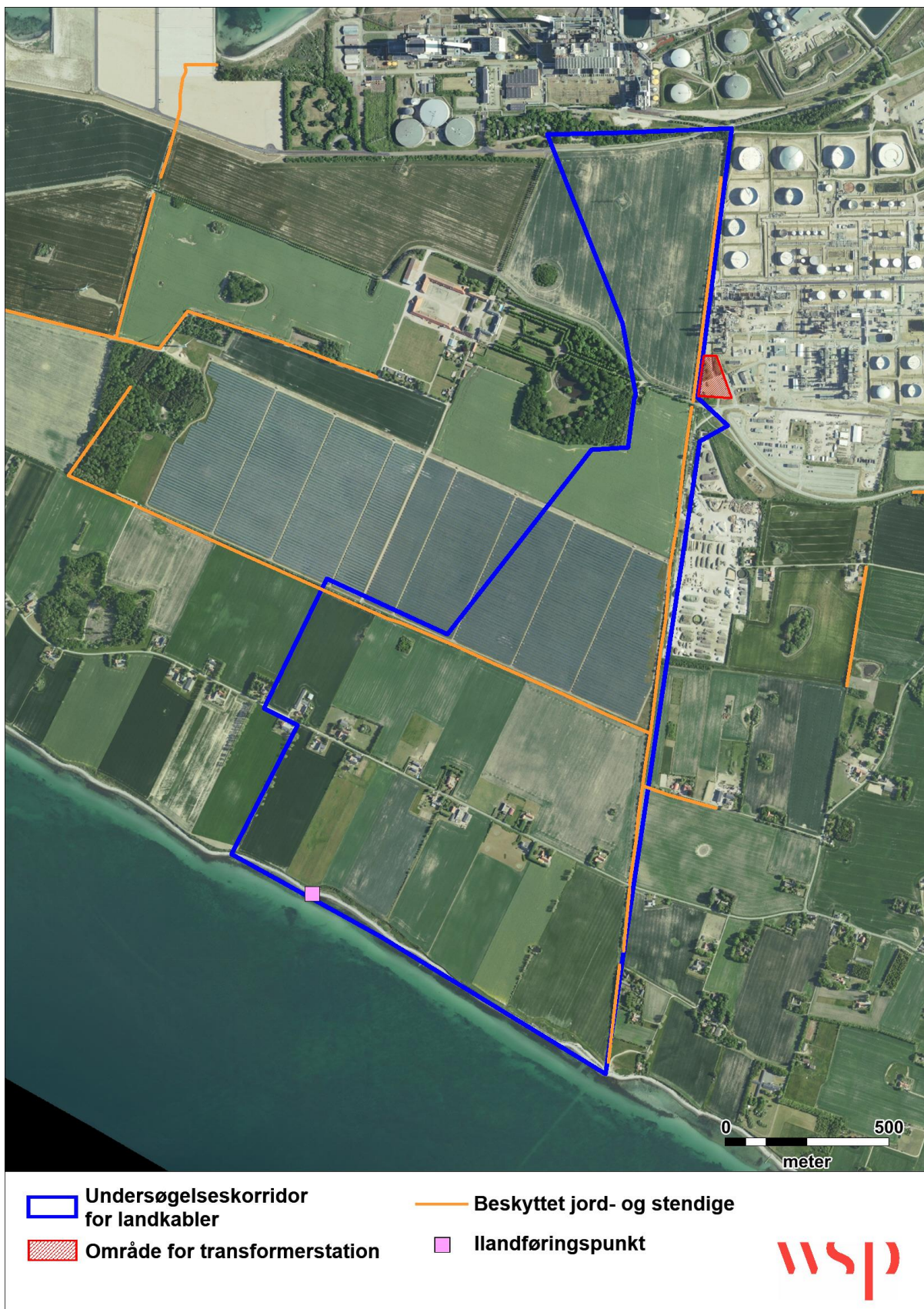
Figur 9 Beskyttede sten og jorddiger ved undersøgelseskorridoren fra miljøportalen.