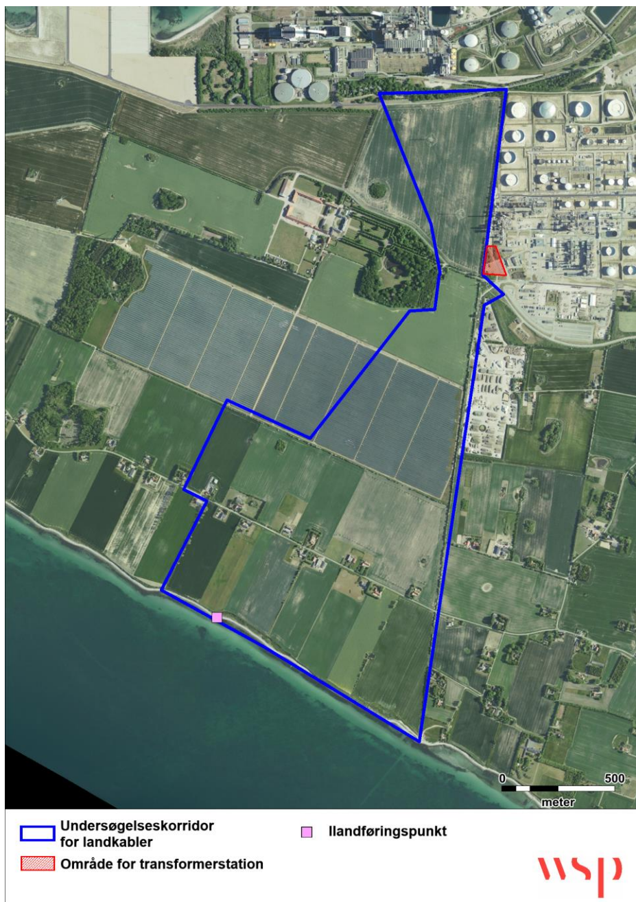
Figur 6 På figuren er vist undersøgelseskorridoren på land samt areal, hvor en ny transformerstation placeres indenfor.

På nedenstående figur er vist undersøgelseskorridoren samt placering af ny transformerstation på land.