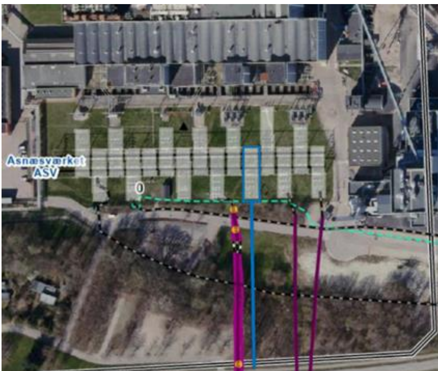
Figur 2 132 kV tilslutningsfelt ved Asnæsværket.

Anlægget etableres og ejes af Energinet, og designet skal følge Energinets standarder og krav for design. Anlægget skal udføres med AIS-teknologi som udendørsanlæg. Anlægget udgør den nordlige afslutning af landanlægget for Jammerland Bugt Havmøllepark og sikrer tilpasningen af 132 kV tilslutningsfeltet mellem det eksisterende Asnæsværket og de nye 132 kV landkabler fra havmølleparkens transformerstation. Lokalitet for tilslutningsfeltet kan ses på Figur 2.