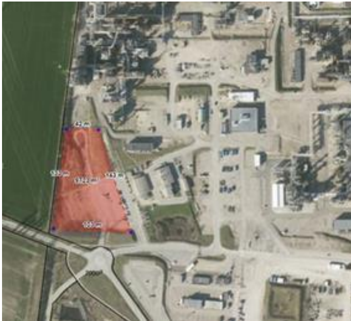
Figur 7 Areal hvor transformatorstationen placeres indenfor.

Det markerede areal til placering af transformatorstation ligger indenfor lokalplan 522.