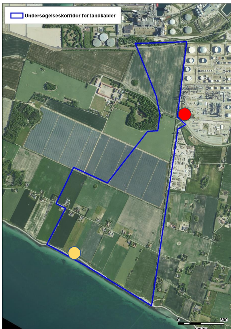
Figur 1 Oversigtskort med afgrænsninger for undersøgelseskorridoren for landkabler (blå optegning). Landkablerne kan enten løbe under det eksisterende solcelleanlæg eller udenom mod øst. Det omtrentlige ilandføringspunkt er angivet med gul cirkel. Den omtrentlige placering af transformerstationen er angivet med rød cirkel.

Det er vigtigt for den praktiske gennemførelse af detailprojektering og de kommende lodsejerforhandlinger, at der både er et konkret forslag til kabeltracé, og at der er mulighed for at fravige det inden for det tilladte undersøgelseskorridoren. For eksempel kan særlige forhold hos lodsejerne eller fund ved de arkæologiske forundersøgelser betyde, at der skal ske justeringer af kabeltracéet efter, at tilladelsen er givet, og derfor skal tilladelsen kunne rumme dette. I forbindelse med bl.a. forhandlinger med de berørte lodsejere, vil der være mulighed for at justere på kabeltracéet indenfor undersøgelseskorridoren.