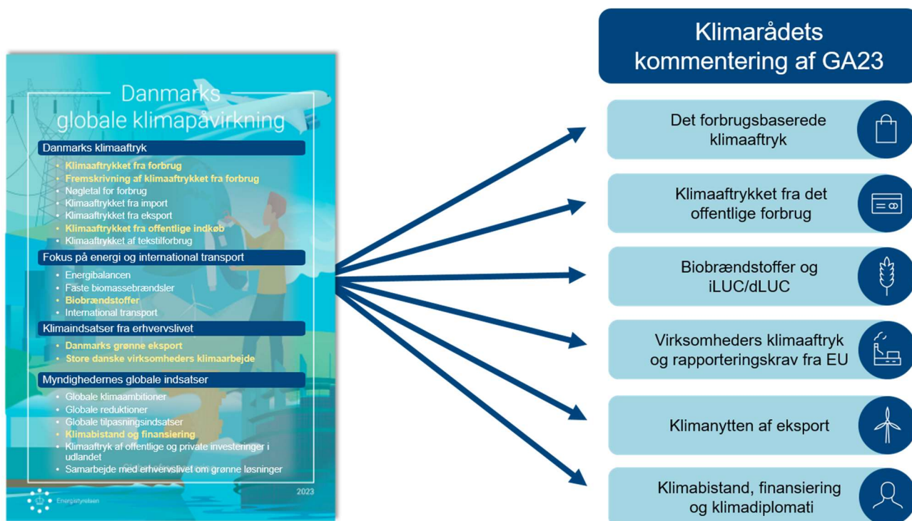
Figur 1 Fokus for Klimarådets kommentering af Global Afrapportering 2023

Den globale afrapportering er på mange områder detaljeret, og udgør således efterhånden et godt grundlag for politisk handling. Fx viser afrapporteringen, at det forbrugsbaserede klimaaftryk er steget med 5 pct. fra 2020-2021, og at klimaaftrykket fra de offentlige indkøb er steget med 12 pct. fra 2019 til 2021. På trods af en fremgang i nogle nøgletal for forbrugsaftrykket, fx et fald i danskernes el og varmekonsum, er den samlede udvikling bekymrende, når Danmark i forvejen har det næsthøjeste forbrugsbaserede klimaaftryk pr. indbygger i EU. 1 Klimarådet vurderer, at resultaterne fra den globale afrapportering i højere grad bør anvendes til at understøtte beslutningsgrundlaget for Danmarks internationale klimaindsatser. Dette vil Klimarådet komme nærmere ind på i forbindelse med en kommende analyse af Danmarks globale klimaindsats.