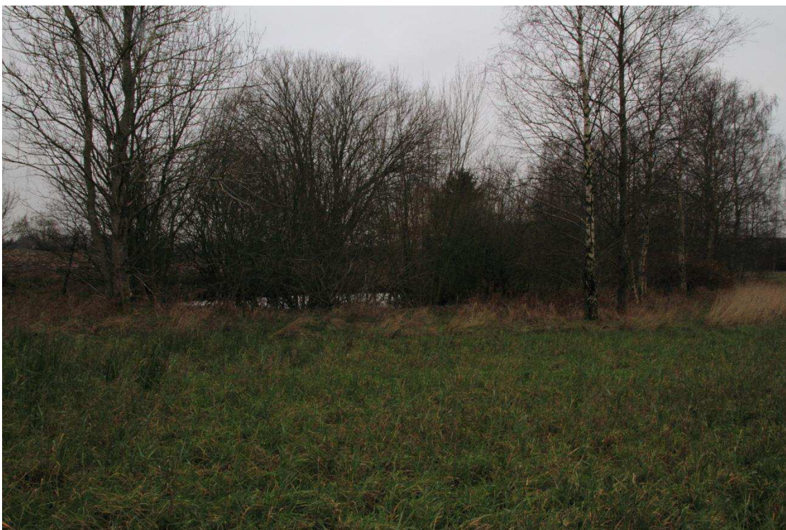
Kriegers Flak Havmøllepark_VVM _Natur_Baggrundsnotat_Bilag 2