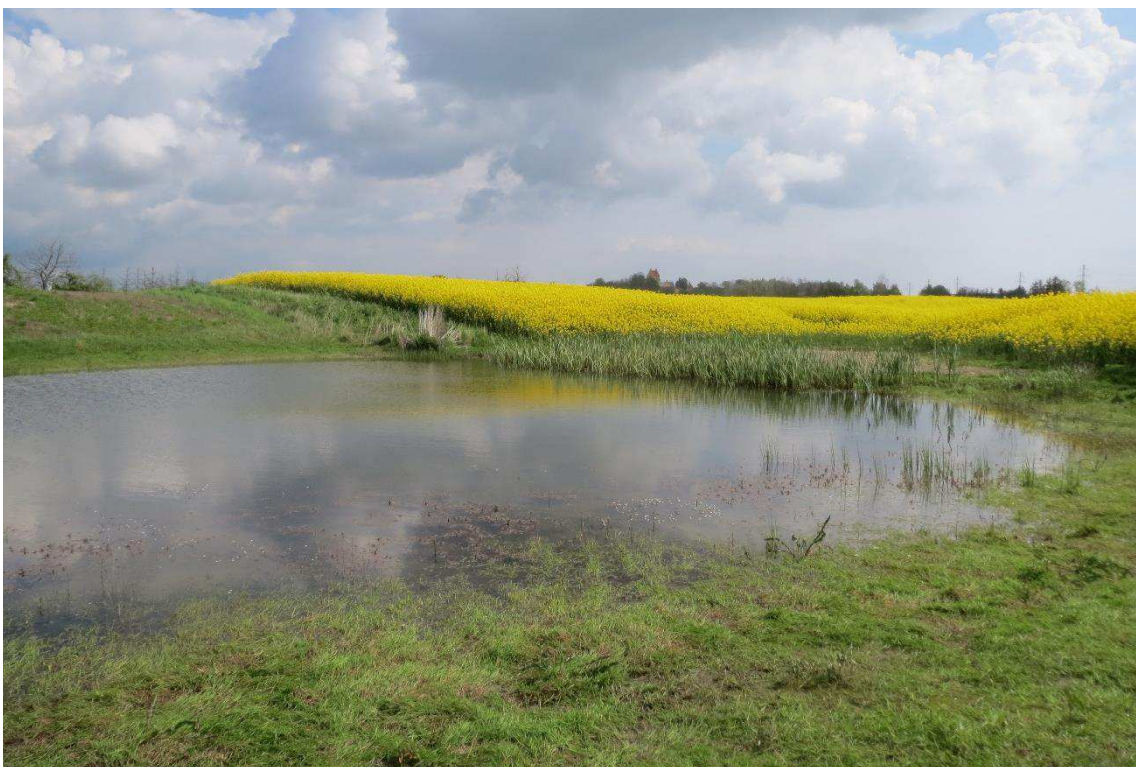
Kriegers Flak Havmøllepark_VVM _Natur_Baggrundsnotat_Bilag 2