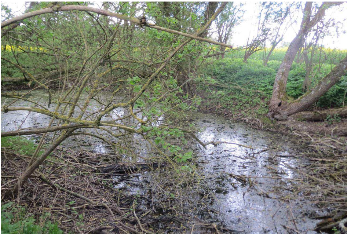
Kriegers Flak Havmøllepark_VVM _Natur_Baggrundsnotat_Bilag 2