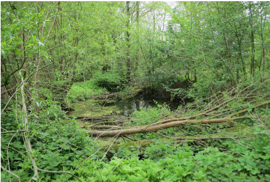
Kriegers Flak Havmøllepark_VVM _Natur_Baggrundsnotat_Bilag 2