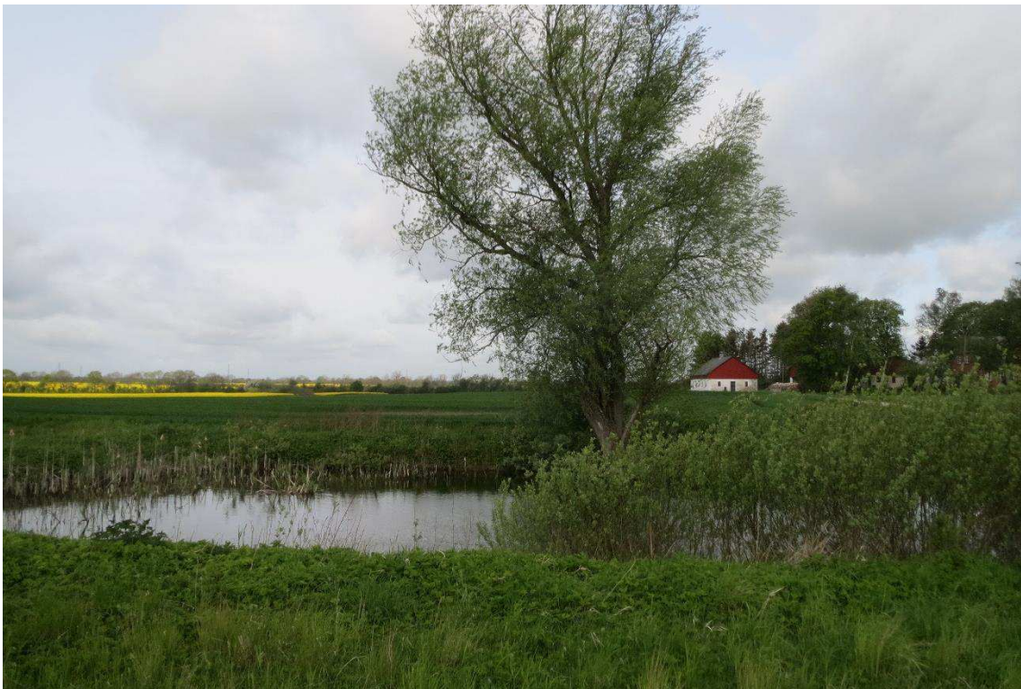
Kriegers Flak Havmøllepark_VVM _Natur_Baggrundsnotat_Bilag 2