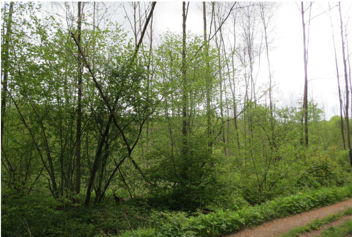
Kriegers Flak Havmøllepark_VVM _Natur_Baggrundsnotat_Bilag 2