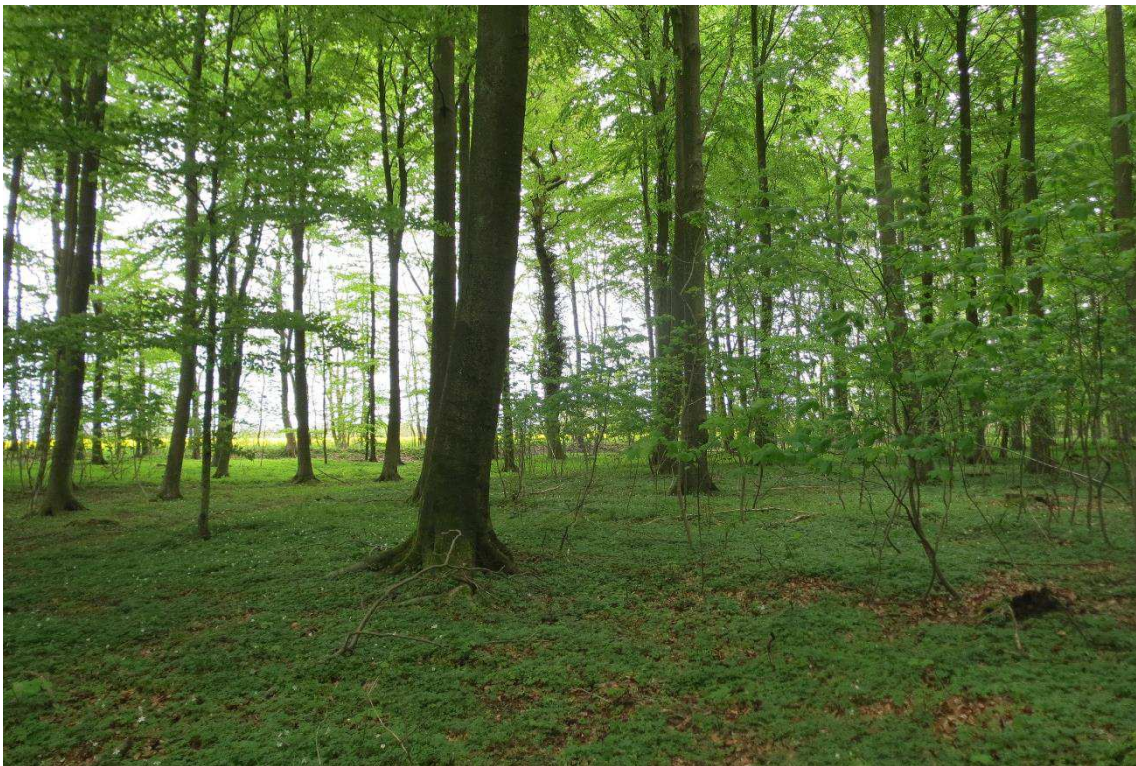
Kriegers Flak Havmøllepark_VVM _Natur_Baggrundsnotat_Bilag 2 Lokalitet 225 - nord