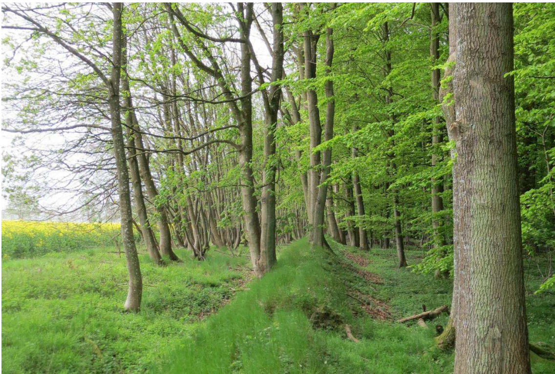
Kriegers Flak Havmøllepark_VVM _Natur_Baggrundsnotat_Bilag 2