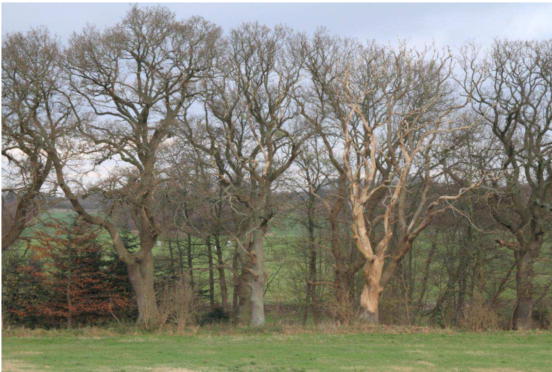
Kriegers Flak Havmøllepark_VVM _Natur_Baggrundsnotat_Bilag 2