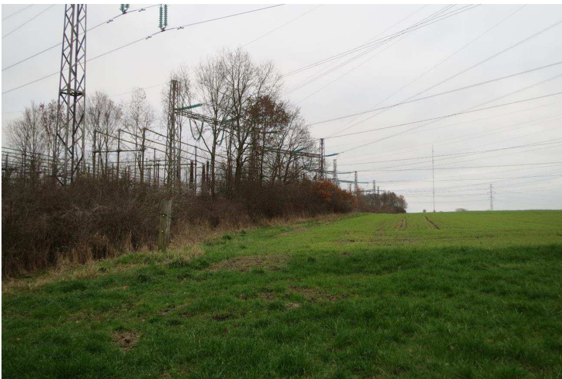
Kriegers Flak Havmøllepark_VVM _Natur_Baggrundsnotat_Bilag 2