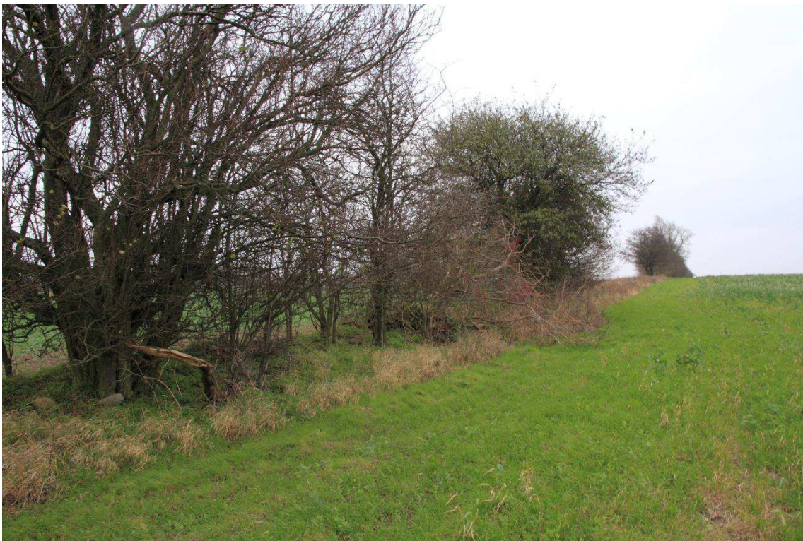
Kriegers Flak Havmøllepark_VVM _Natur_Baggrundsnotat_Bilag 2