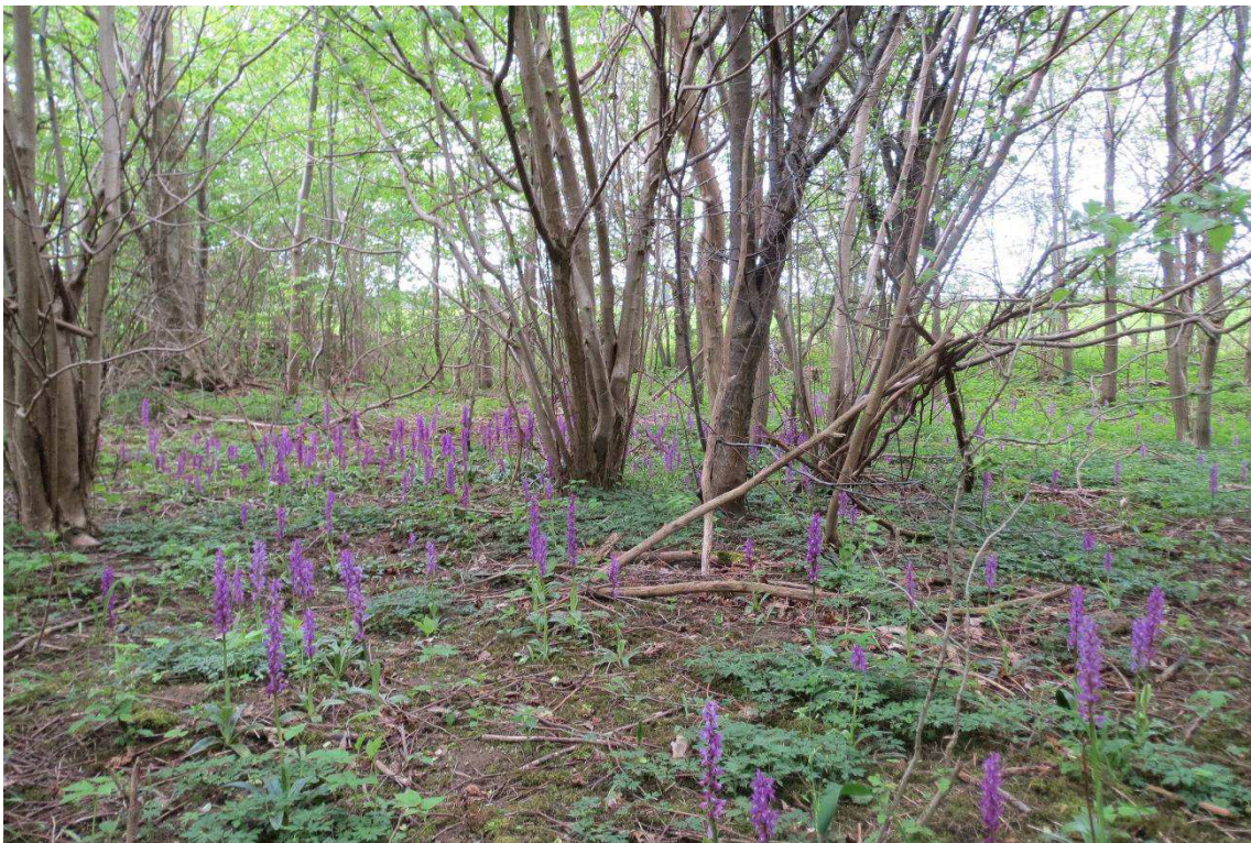
Kriegers Flak Havmøllepark_VVM _Natur_Baggrundsnotat_Bilag 2