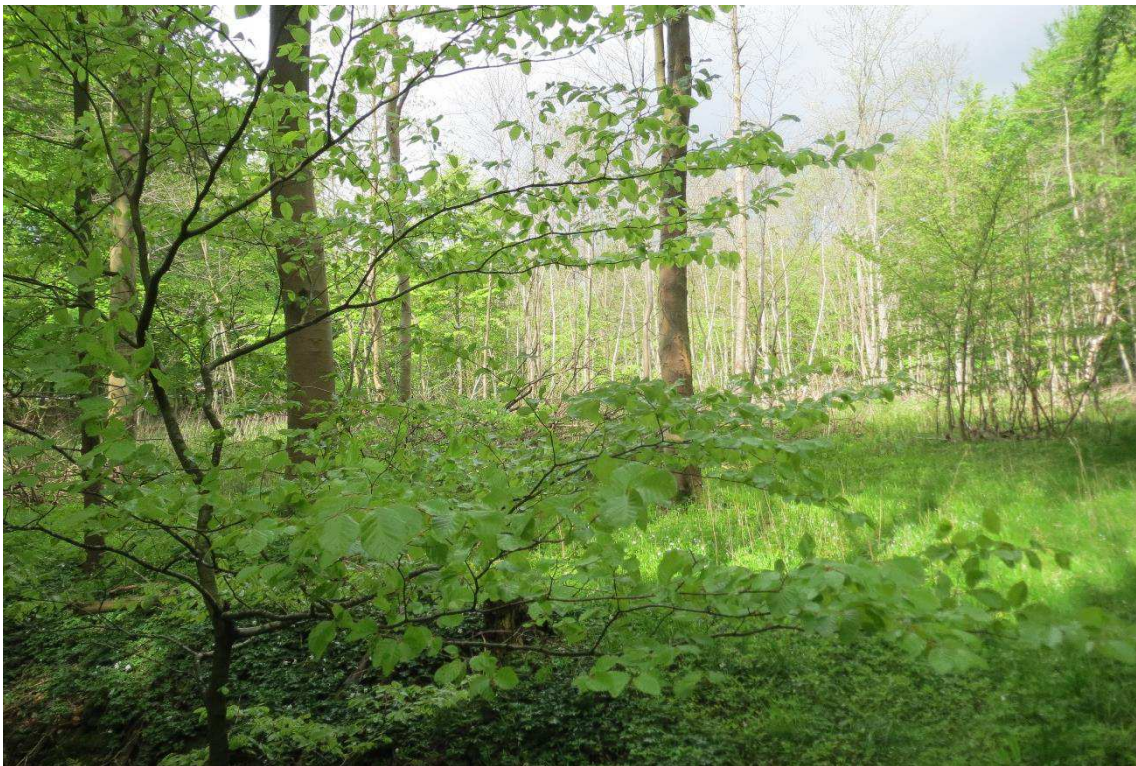
Kriegers Flak Havmøllepark_VVM _Natur_Baggrundsnotat_Bilag 2