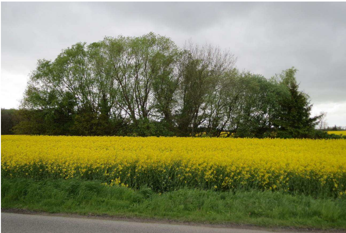
Kriegers Flak Havmøllepark_VVM _Natur_Baggrundsnotat_Bilag 2