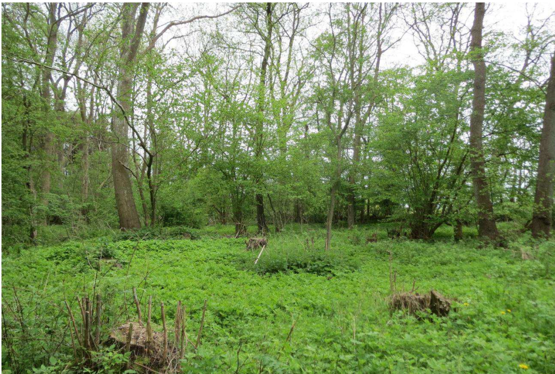
Kriegers Flak Havmøllepark_VVM _Natur_Baggrundsnotat_Bilag 2