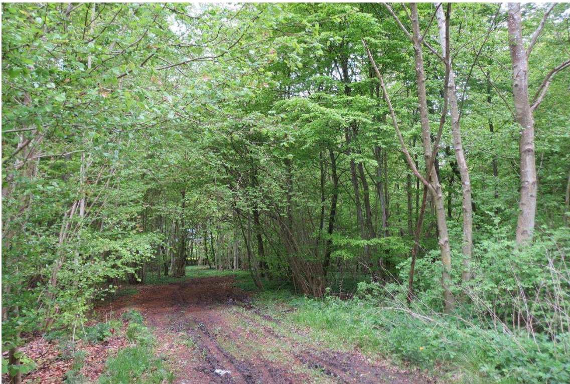
Kriegers Flak Havmøllepark_VVM _Natur_Baggrundsnotat_Bilag 2