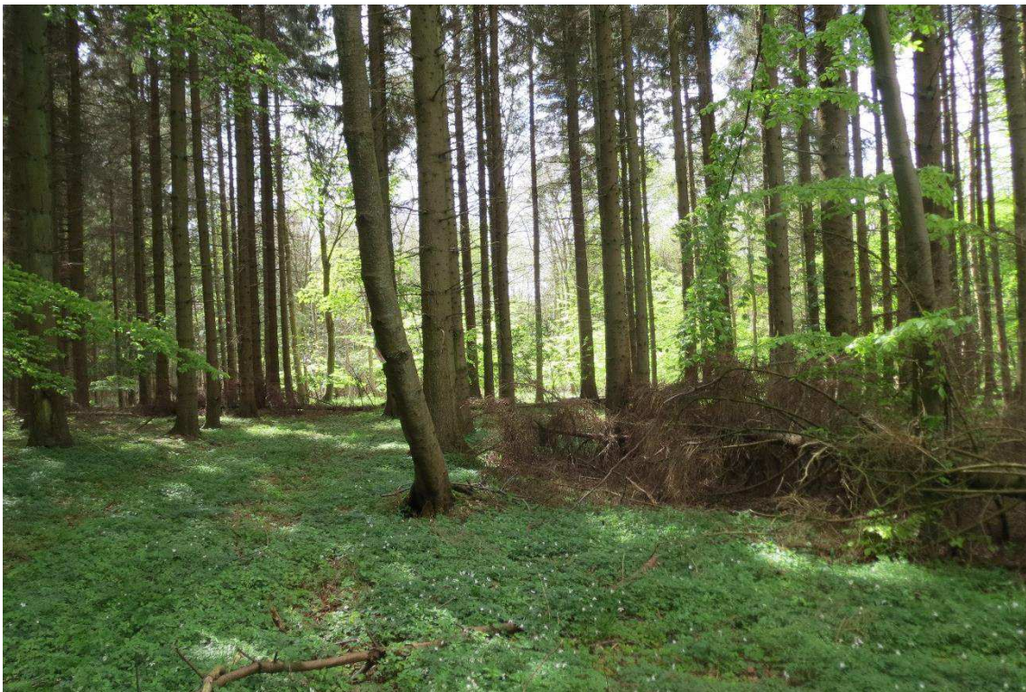
Kriegers Flak Havmøllepark_VVM _Natur_Baggrundsnotat_Bilag 2 Lokaltet 225 – nord