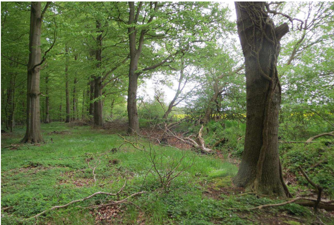
Kriegers Flak Havmøllepark_VVM _Natur_Baggrundsnotat_Bilag 2