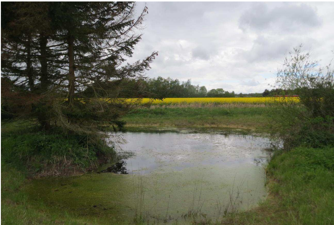
Kriegers Flak Havmøllepark_VVM _Natur_Baggrundsnotat_Bilag 2