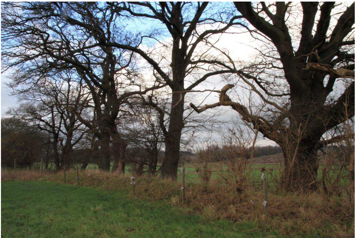
Kriegers Flak Havmøllepark_VVM _Natur_Baggrundsnotat_Bilag 2