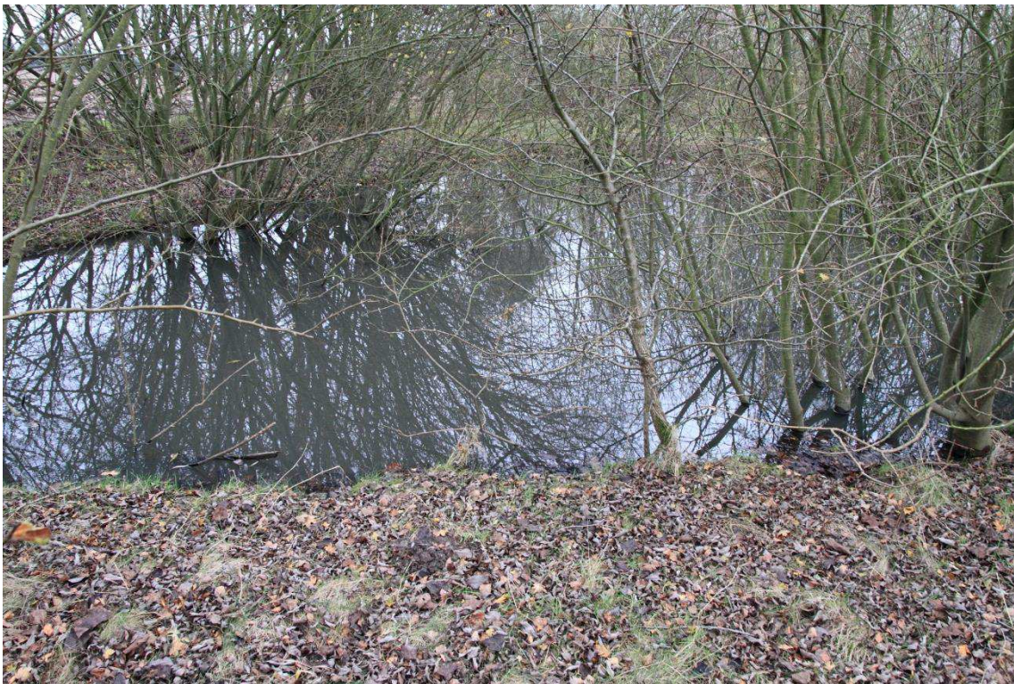
Kriegers Flak Havmøllepark_VVM _Natur_Baggrundsnotat_Bilag 2