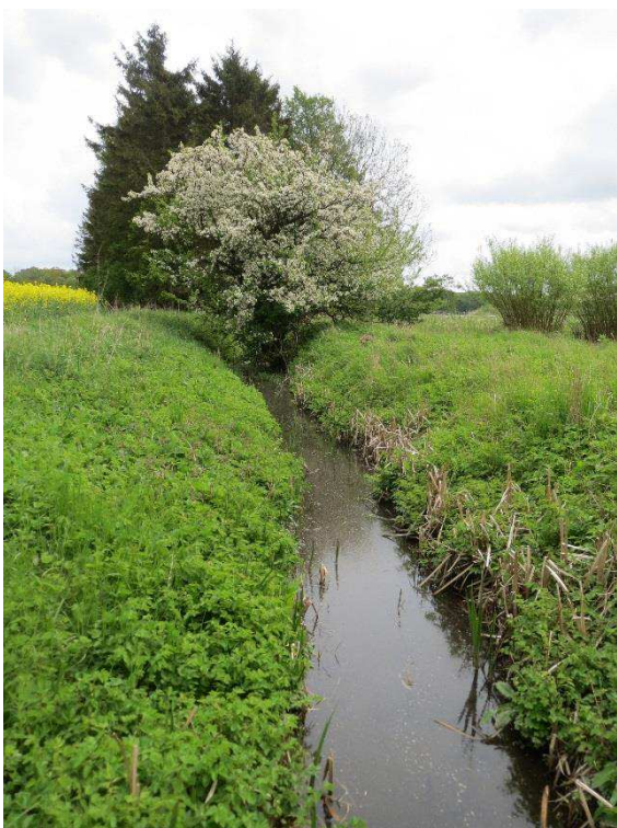
Kriegers Flak Havmøllepark_VVM _Natur_Baggrundsnotat_Bilag 2