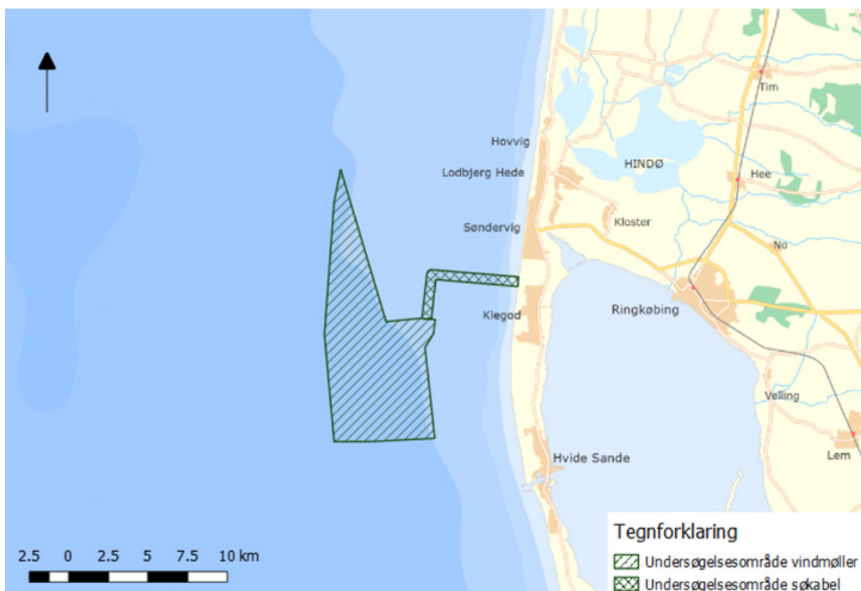
Figur 1. Oversigtskort over området for undersøgelser til projektet.

Vesterhav Syd skal kunne producere op til 170 MW. Møller og søkabler skal placeres inden for et fast defineret område på havet (se figur 1). Mølleområdet ligger mellem cirka 4 og 9 km fra kysten nordvest for Hvide Sande og har et samlet areal på 37,4 km 2 . Vanddybden i mølleområdet er mellem 15 og 25 meter.