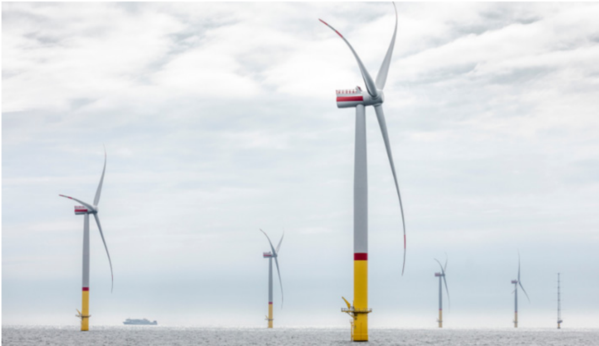
Figur 2. Grå vindmøller på havet med gul markering på den nederste del af møllens tårn. De endelige møller kan afvige fra den, som er vist på billedet (eksempelvis vil der ikke være rød bemaling på møllerne).