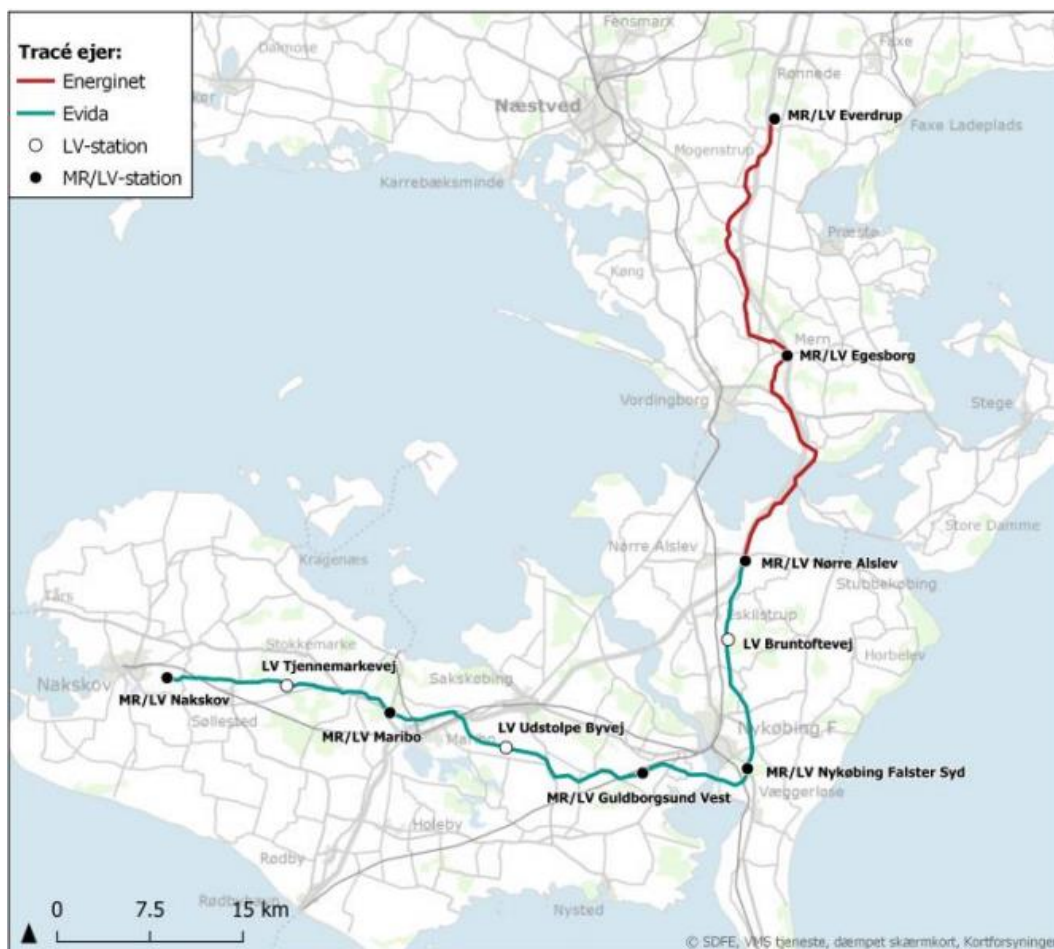
Figur 1 viser hoveddelende af Grøn Gas Lolland-Falster

Dette dokument er et resume af Energinet's ansøgning til Energistyrelsen om tilladelse til etablering af gasrørledninger over Færgestrømmen og Grønsund. De ansøgte rørledninger har til formål at styrke transmissionens systemet ned mod Lolland og Falster, og derigennem facilitere en fremtidig udvikling af området. Projektet planlægges og bygges i et samarbejde mellem Evida og Energinet.