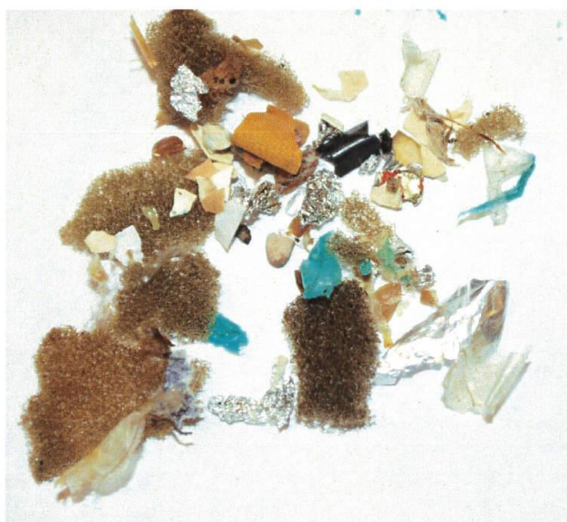
Figur 3 Eksempler på frasorterede emner. Der ses grøn plastfolie fra pose rester, mindre plastemner, rester af skum, og rester af alufolie. Emnerne er forstørrede.

Herefter bestemmes andelen af store partikler i "ikke naturligt forekommende restaffald".