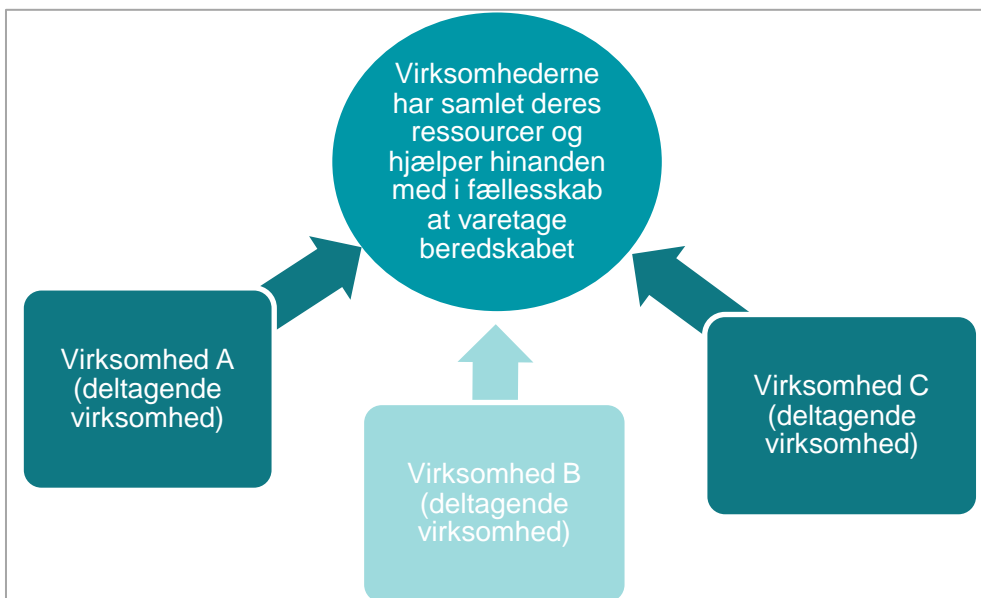
Figur 2: Samordnet beredskab med fælles ansvar (type 2).

Den anden og mindre anvendte måde at have samordnet beredskab på er, når virksomhederne i fællesskab varetager beredskabet på tværs af alle de virksomheder, der deltager (type 2):