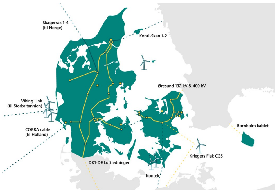
Figur 3: Danske ind- og udlandsforbindelser

Blå forbindelser: HVDC-forbindelser; gule forbindelser: AC-forbindelser. Bornholmsforbindelsen inkluderes normalt ikke i Energinets modelberegninger af Østdanmarks elsystem og er derfor ikke en del af AF. Kilde: Energinet.