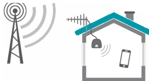
Figur 3. Signalforstærkeren modtager mobilsignalet, forstærker det og udsender det igen indendørs.

Hvis man anvender frekvenserne uden, at man har en tilladelse, vil det være en overtrædelse af de gældende regler, som vil kunne straffes med bøde.