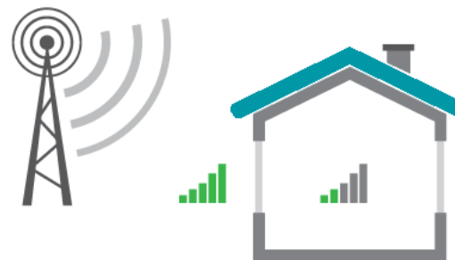
Figur 1. Mobilsignalerne dæmpes, når de passerer gennem vægge og vinduer.

Dækningen fra det overordnede mobilnet i en given bygning afhænger af, hvor meget signalet dæmpes af vægge og vinduer. Dæmpningen af radiosignalet afhænger af flere faktorer såsom materialetype (beton, mursten, træ, gips, glas, metal), materialetykkelse, radiosignalets indfaldsvinkel til huset m.v.