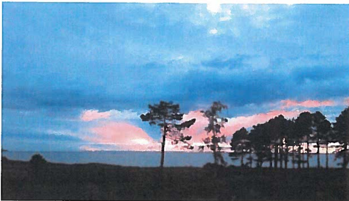
Solnedgang ved Vollerup Vang

Lige nu er vores kystlinje en del af et større uforstyrret landskab, der både mod øst og vest er omkranset af Natura 2000-områder. Vi er endda fri for udsigt til tekniske anlæg så som skorstene eller pyloner. Det nattemørke kystrum og stilheden er virkelig enestående for os her langs Sejerøkysten.