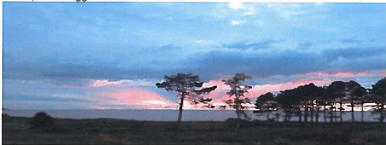
Solnedgang fra Vollerup over Sejerø Bugt

Som vi har det nu, kan vi i sommerhalvåret glæde os over at se solen gå både ned og op over det åbne hav. Der er vist i grunden ikke så mange steder i landet, hvor begge dele kan ses fra samme sted!